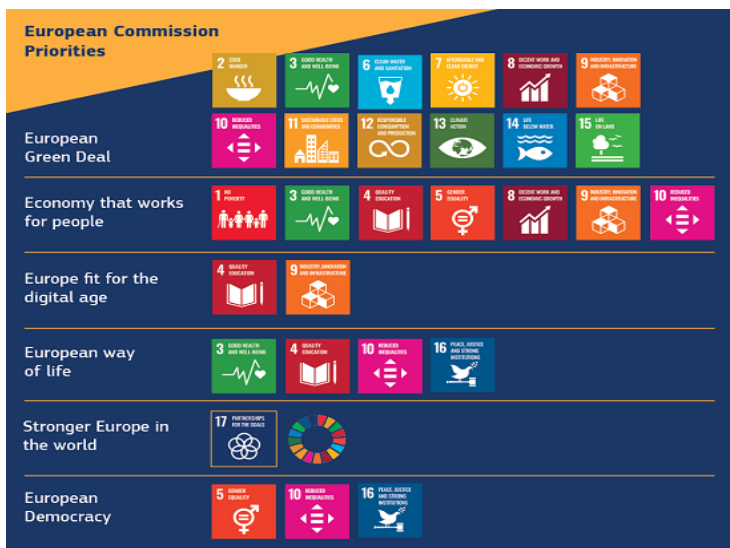
Figura nr.5 - Obiectivele de dezvoltare durabilă la nivelul UE